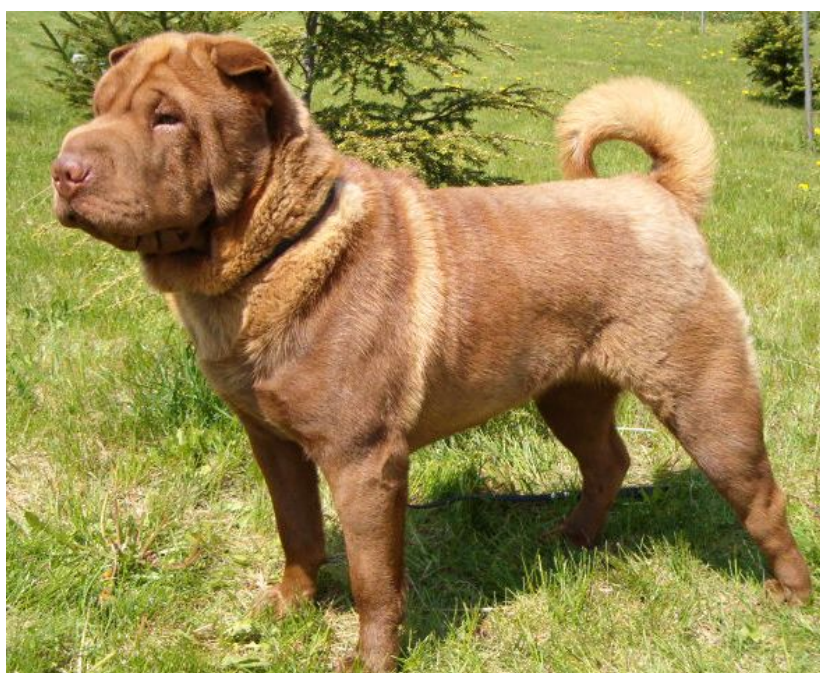
LADY CHOCO iz Kitaiskogo Kvartala