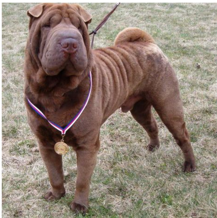
NOCHNOI DOZOR iz Kitaiskogo Kvartala