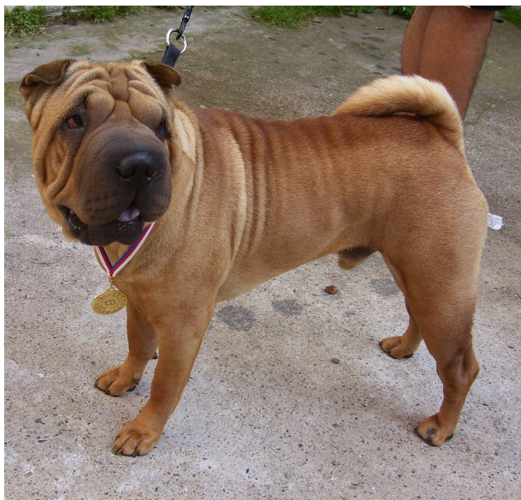
CH.GOLDING CRYSTLE Quasar