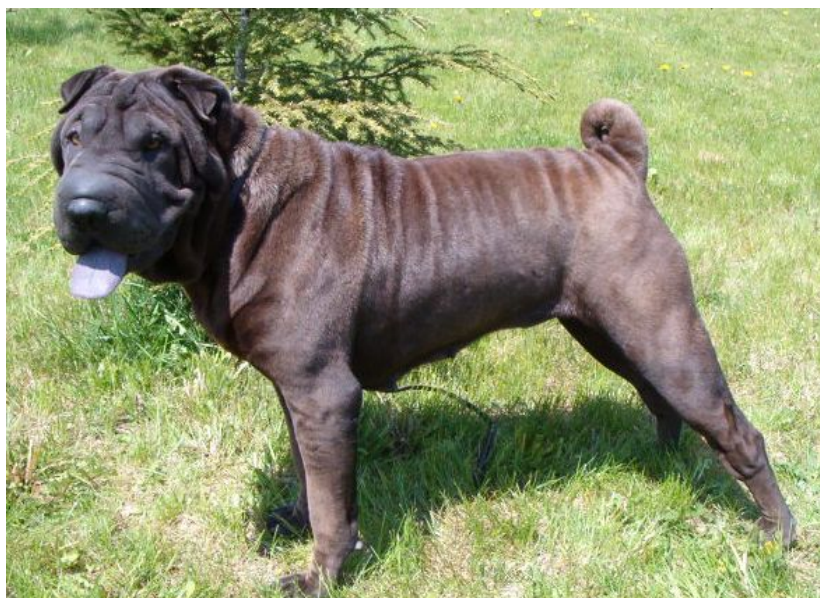
DEBIE BLACK Best Pei