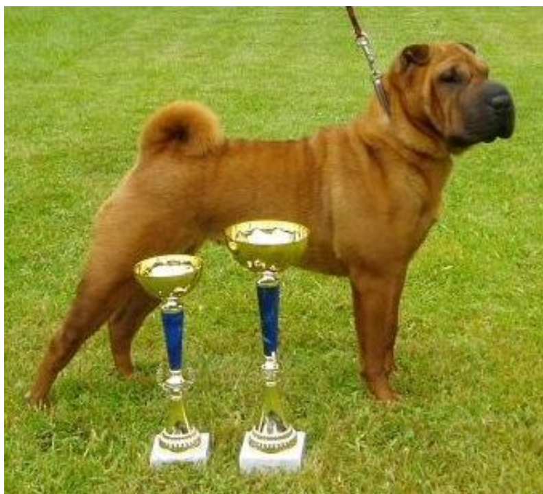
CERRY RED Pet Pei