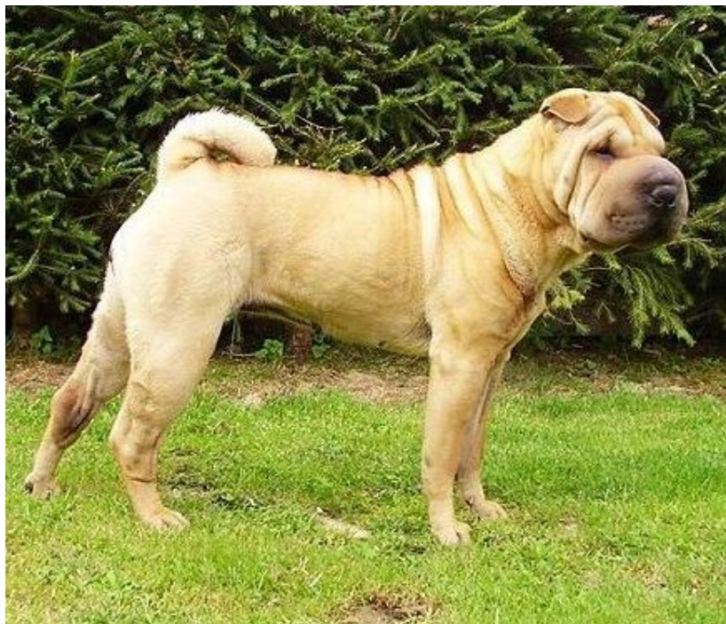
BAFFY Gampi Pei